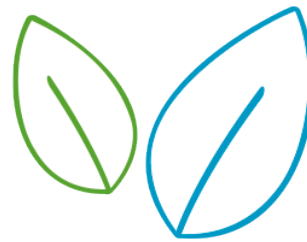
Sekundäre Pflanzenstoffe (Superfoods)