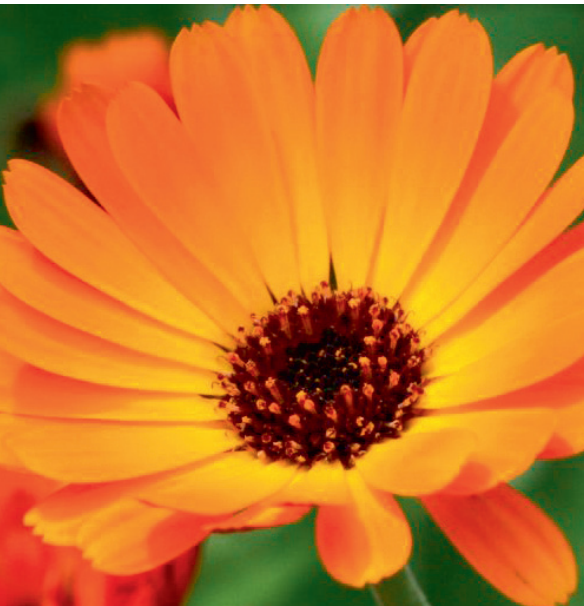
Calendula – Ringelblume

der Herstellung und der nichtindividuellen Anwendung. Zur Phytotherapie gehören u. a. pflanzliche Extrakte für Tees und Umschläge, Präparate zum Einnehmen oder äußerlich anzuwendende Salben zum Beispiel mit Arnika, Kamille, Ringelblume oder Propolis. Gerade für Neurodermitiker aber gilt: Vorsicht – einige Pflanzen bzw. Pflanzenprodukte, insbesondere Arnika und Propolis, lösen häufig Allergien aus!