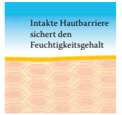
Intakte, schützende Hautbarriere mit Linol-säure-reichen Lipiden.

Gleichgültig ob innere oder äußere Ursachen vorliegen, die Folge ist immer gleich: eine trockene, gereizte oder irritierte Haut, die verstärkt zu Entzündungen, Juckreiz und Ekzemen neigt. Um den daraus resultierenden Belastungen entgegenzuwirken und die Haut vor weiteren Schäden zu schützen ist die einzigartigen Formulierung der