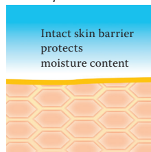
Intact protective skin barrier with lipids rich in linoleic acids.

Visit us at www.linola.com and select the drop-down menu "country". Here you will find all the latest information on Linola Lotion, Linola Face, Linola Hand and Linola Foot Lotion as well as other Linola products for a wide range of skin problems.