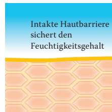
Intakte, schützende Hautbarriere mit Linolsäure-reichen Lipiden.

Dr. August Wolff GmbH & Co. KG Arzneimittel 33532 Bielefeld, GERMANY